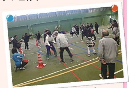
〈しっぽとりゲーム〉

※進行の状況によっては時間を変更する場合があります ※イベントの様子を撮影をさせていただき広報誌等に使用する場合がありますのでご了承ください