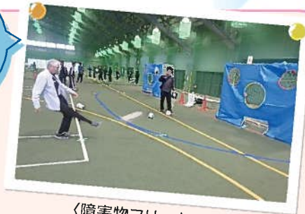
〈障害物フリーキック〉