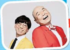
司会 新宿カウボーイ